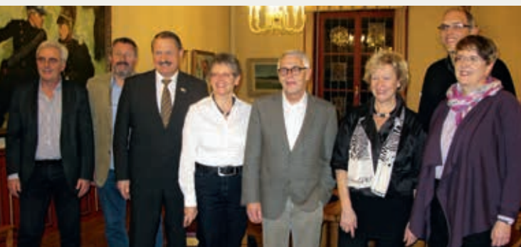
» Gemeinderat 2013 – 2016

Der Gemeinderat führt die Gemeinde. Er plant und koordiniert ihre Tätigkeiten und ihm stehen alle Befugnisse zu, die nicht durch Vorschriften des Bundes, des Kantons oder Gemeinde einem anderen Organ übertragen sind. Er vertritt die Stadt nach aussen und repräsentiert diese gegenüber der Öffentlichkeit und den Medien. Der Gemeinderat betreut 7 Ressorts und hält wöchentlich Sitzungen ab. Er entscheidet als Kollegium und verfügt über eine abschliessende Finanzkompetenz von 300'000.– Franken.