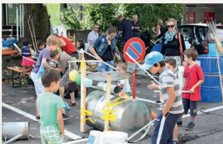
» Begegnungsfest «Burgdorf – eine Stadt, 94 Nationen»