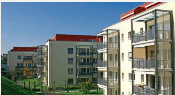
» Seniorenresidenz Burdlef