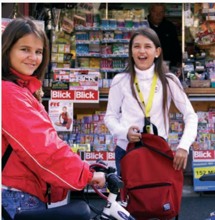
» Jugendliche im Kornhausquartier