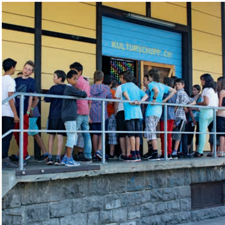
» Event der Offenen Jugendarbeit Burgdorf und Umgebung