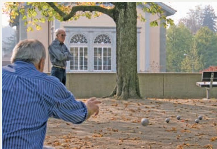
» Pétanque auf der Gebrüder Schnell Terrasse