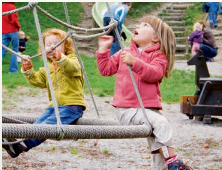
» Kinderspielplatz am Ententeich

Internet: www.burgdorf.ch/institutionen.html