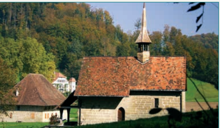
» Bartolomäus-Kapelle und Siechenhaus

Burgdorf wird 1384 von den Bernern und Eidgenossen erfolglos belagert. Trotzdem müssen die konkursen Grafen von Kiburg Stadt und Schloss Burgdorf an Bern verkaufen.